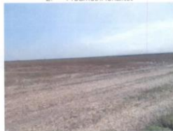
4. Predmetni lokalitet