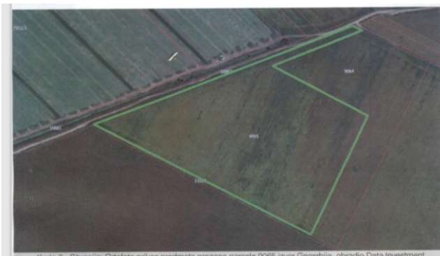
Karta 2 - Situacija: Ortofoto prikaz predmeta procene parcele 9065