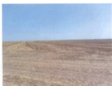
1. Predmetni lokalitet