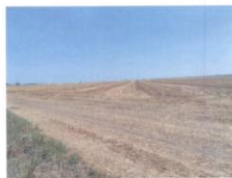
2. Predmetni lokalitet